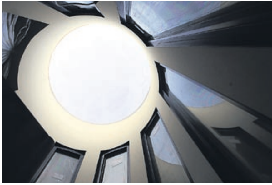
Das Architekten-Kollektiv hat beim kompletten Wiederaufbau viel Respekt vor dem historischen und städtebaulichen Wert des Ensembles gezeigt.